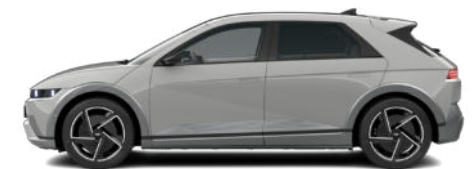
Cyber Gray Metallic