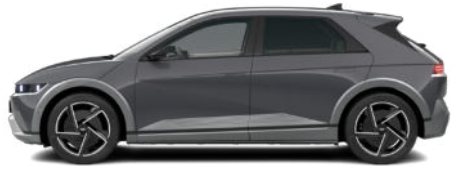
Ecotronic Gray Pearl