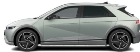
Celadon Gray Matte