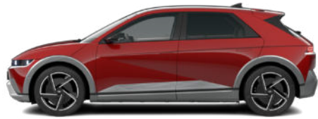
ohne Aufpreis Ultimate Red Metallic