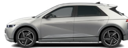
Gravity Gold Matte