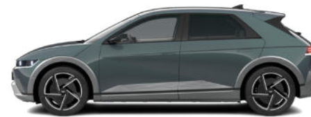
Digital Teal-Green Pearl