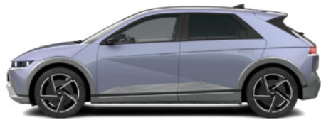
Meta Blue Pearl