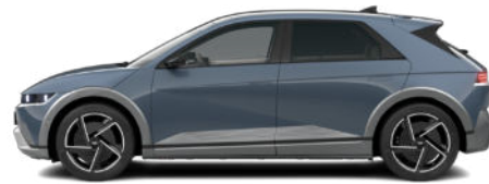
Lucid Blue Pearl