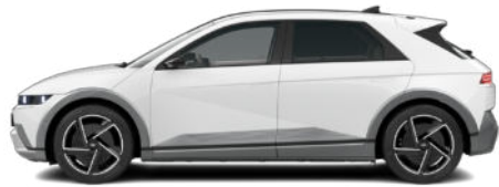
Aufpreis € 390,- Atlas White